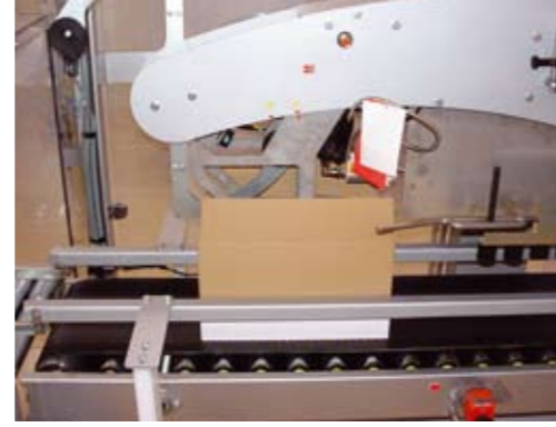
Encolado solapas superiores