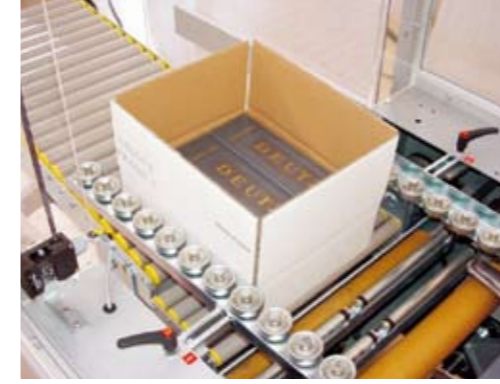
Encolado solapas superiores e inferiores